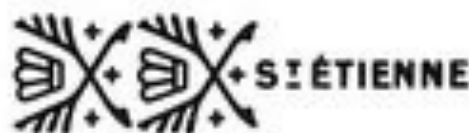
CANONS FINS ASSEMBLÉS ÉPREUVE DOUBLE Poinçon L. N. 1000 du 20/22