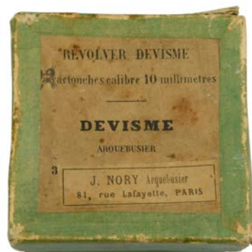
Boîte d'époque pour revolver Devisme mle 1858.

Ainsi depuis 27 ans, les pyrothécophiles collectionnent les munitions anciennes. Et ce n'est pas parce que des « faux anciens » inondent le marché qu'il faut pénaliser les puristes.