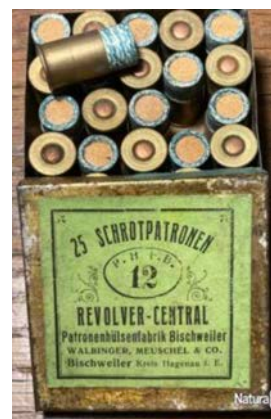
Vu sur Naturabuy le 19 juin 2022

Une boîte de 25 cartouches de 1873 fabriquées au début du XX ème siècle est proposée à 120 €. Une seule cartouche de revolver Devisme a une valeur de 80 €, une cartouche de Pidault & Cordier 120 €...Et ces prix élevés correspondent à des munitions qui ne fonctionnent pas.