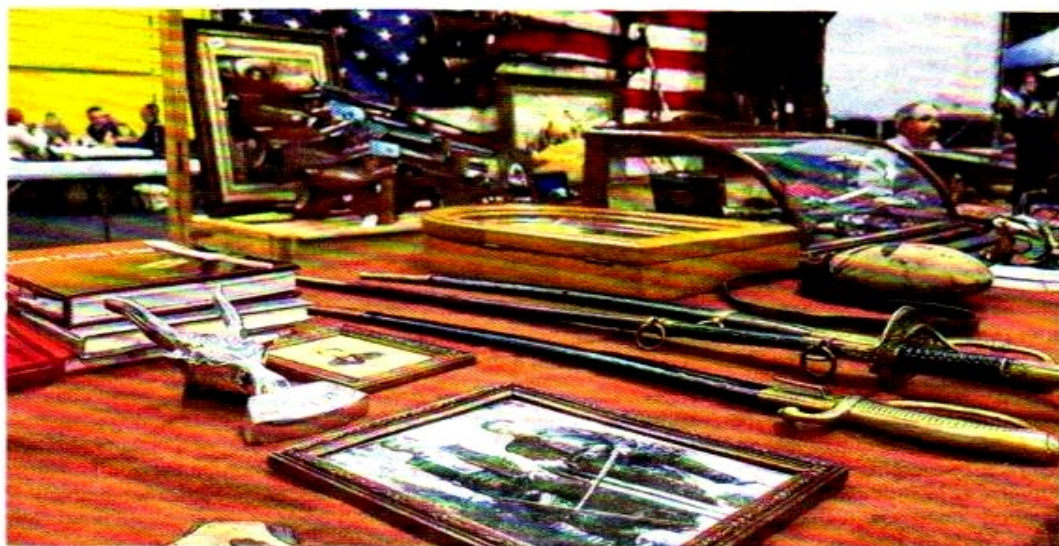
Bel écrin pour un Salon d'exception.

Son édition 2018 devrait d'autant plus faire date que le nombre de particuliers qui ont réservé des stands augmente significativement. Cette montée en puissance offre la perspective de belles surprises aux passionnés les plus exigeants qui pourront découvrir, voire acquérir, des pièces qui n'étaient pas jusqu'à présent sur le marché.