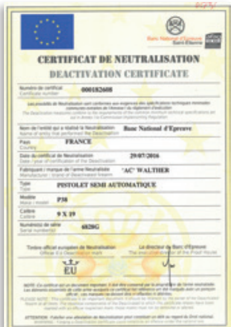
Le nouveau certificat de neutralisation est sécurisé avec un filigrane spécial et des couleurs infalsifiables.

à côté de ce problème. A part des descentes chez des collectionneurs à 6h00 du matin, rien n'a été fait dans la législation française pour réglementer les armes à blanc. Les seuls textes existant soumettent ces armes à un contrôle de l'Etat uniquement si la transformation est faite en France ! Ainsi, une des commissions du Parlement Européen (3) chargée d'étudier le texte sur lequel l'ensemble des députés européens doit se prononcer à la mi-novembre 2016 déclare que : « Le nouveau règlement d'exécution sur la neutralisation, ... confronte les