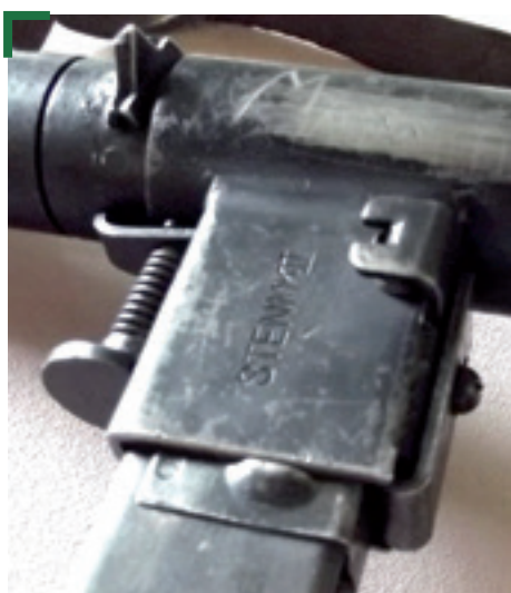
Sur la Sten MK II aucune trace visible à l'extérieur, le système qui rend le chargeur indémontable n'est pas visible de l'extérieur.

Aujourd'hui, les chambres du barillet communiquent entre elles. Auparavant, elles étaient juste élargies mais cela n'empêchait pas le tir de munitions d'un calibre un peu supérieur. Cette situation pouvait constituer un danger pour celui qui se livrait à ce jeu et pour son entourage car le canon, lui ne changeait pas de calibre!