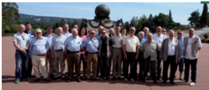
Après le travail intense du congrès, les délégués se sont accordé un peu de détente en visitant le Musée de la Légion à Puylobier et à Aubagne, et le Musée de l'Empéri à Salon de Provence. Comme on peut dire, c'est du tourisme culturel. Photo devant le Monument aux Morts de la Légion à Aubagne.

Il a été décidé que le congrès 2017 se tiendrait à Madrid. Les congressistes ont chaleureusement remercié l'UFA pour la belle organisation du congrès 2016. Cette rencontre est une occasion unique pour interagir et pour planifier une stratégie efficace.