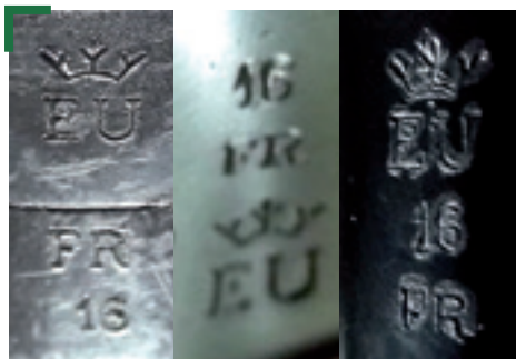
Les poinçons des trois armes examinées comportent les lettres EU couronnées, ainsi que l'initiale du pays (FR) et l'indication de l'année de neutralisation (2016).

à côté de ce problème. A part des descentes chez des collectionneurs à 6h00 du matin, rien n'a été fait dans la législation française pour réglementer les armes à blanc. Les seuls textes existant soumettent ces armes à un contrôle de l'Etat uniquement si la transformation est faite en France ! Ainsi, une des commissions du Parlement Européen (3) chargée d'étudier le texte sur lequel l'ensemble des députés européens doit se prononcer à la mi-novembre 2016 déclare que : « Le nouveau règlement d'exécution sur la neutralisation, ... confronte les