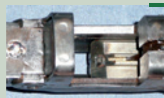
Par exemple, nous pouvons voir sur cette ancienne neutralisation de PPSH la tête de culasse fraisée à 45% et l'orifice du percuteur bouché avec de la soudure auto-trempante. Aujourd'hui, une telle expertise serait impossible, l'accès par le puits du chargeur étant rendu impossible par sa fixation.

(1) Directive 91/477 modifiée, annexe I III 5a).