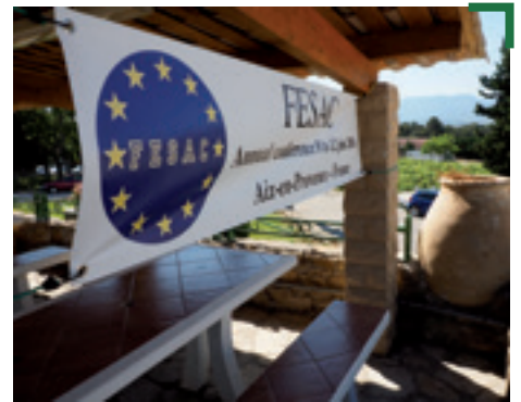
Le congrès s'est déroulé dans le cadre atypique de la maison de retraite de la Légion Etrangère à Puylobier. L'atmosphère confraternelle entre les pensionnaires a été contagieuse et le congrès restera dans la mémoire des différents délégués.

Les 32 congressistes sont venus de 16 pays différents. Bien malgré nous, c'est l'Europe qui a été le sujet principal des conversations. Et c'est durant le congrès que nous avons pu prendre connaissance de la dernière proposition du Conseil Européen. Les soubresauts qu'a connus la législation européenne des armes cette année confirment l'importance pour les collectionneurs de disposer d'un organisme de défense à l'échelle européenne.