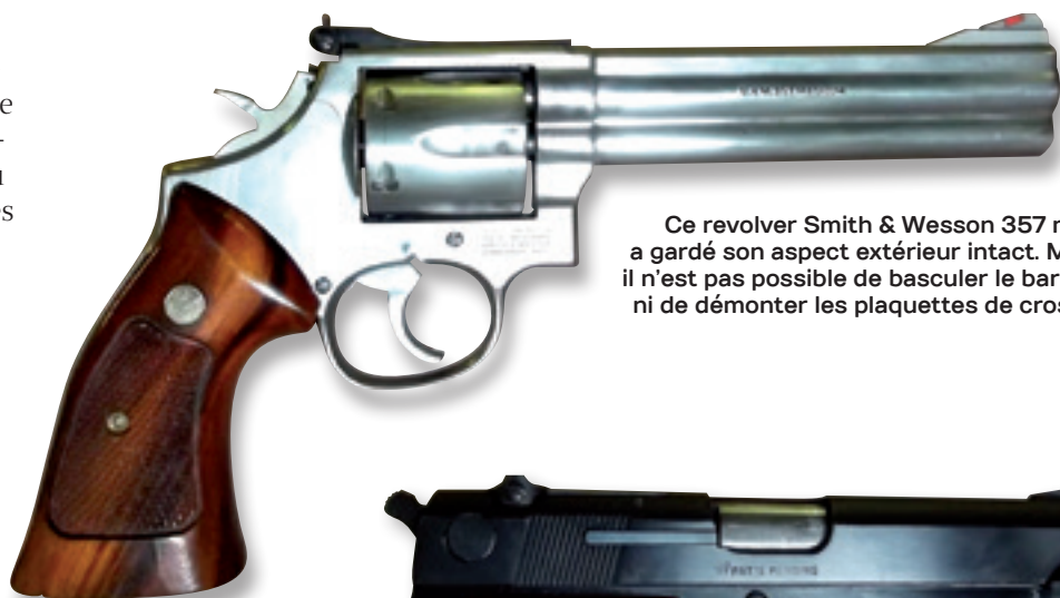
Ce revolver Smith & Wesson 357 mag a gardé son aspect extérieur intact. Mais il n'est pas possible de basculer le barillet ni de démonter les plaquettes de crosse.

mis que 4 semaines pour le bâcler de nouvelles règles de neutralisation dans une précipitation tout à fait dommageable pour l'avenir du patrimoine armurier. Tout le monde sait qu'on ne fait rien de bon dans la précipitation pour des questions aussi délicates. Pourtant, aucune arme neutralisée n'avait jamais été impliquée dans ces attentats, certaines des armes incriminées étant au contraire des armes de guerre transformées « à blanc » de manière réversible, ce qui n'a techniquement rien à voir avec la neutralisation. L'importation sur le territoire français de ce genre de pièce était n'était pas prévue par les textes, c'est finalement aux collectionneurs qu'on s'en est pris. Cela alors que c'étaient les services de l'état qui étaient passés