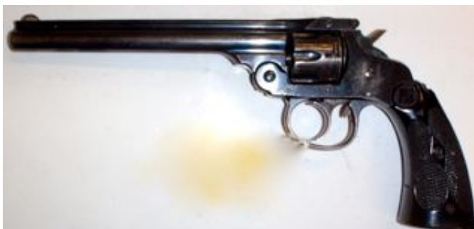
Le Harrington & Richardson est très ressemblant au S&W double action cal 44.

L'ETBS, a donc introduit une notion de date de fabrication, qui ne figure pas dans la loi. Il s'agit d'un choix technique propre à cet établissement, qui ne nous paraît pas fondé en droit, mais qui correspondait très certainement à une volonté de limiter les importations de versions trop récentes d'armes de catégorie D2.