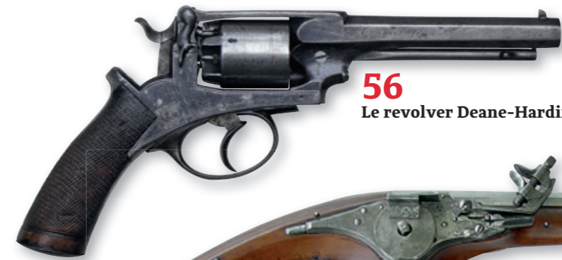
56 Le revolver Deane-Harding.