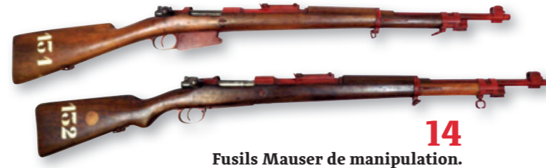
14 Fusils Mauser de manipulation.