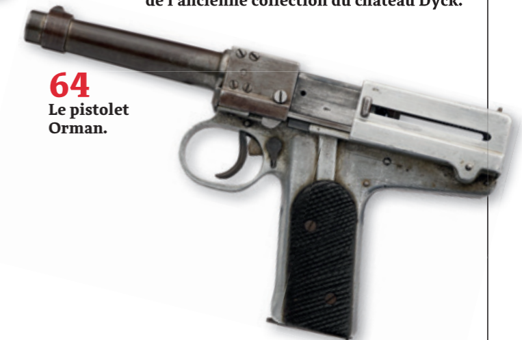
64 Le pistolet Orman.