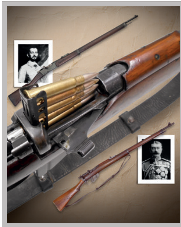
16 Le Lebel face au Lee-Metford MKII.