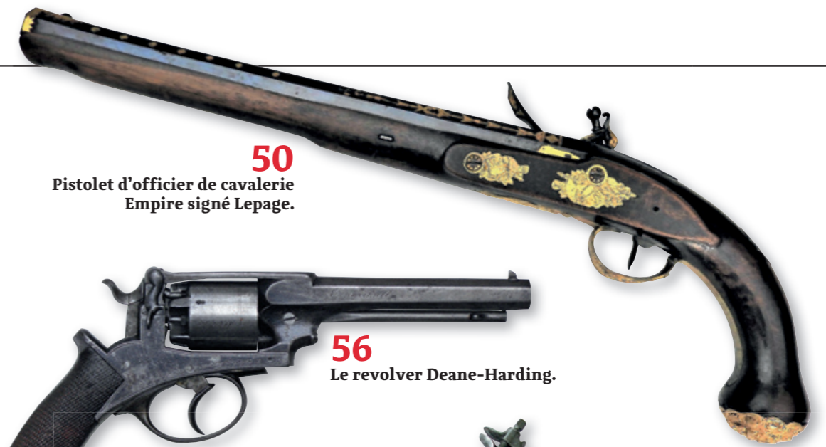
50 Pistolet d'officier de cavalerie Empire signé Lepage.