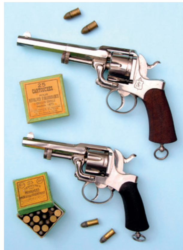
32 L'histoire des armes à feu nickelées.