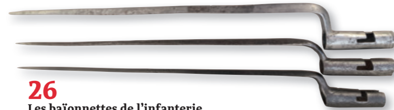
26 Les baïonnettes de l'infanterie du temps de Louis XIV.