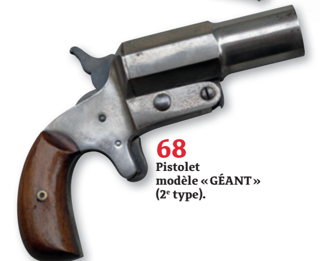
68 Pistolet modèle « GÉANT » (2 e type).